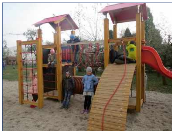
ŠD je na školní zahradě v každém ročním období