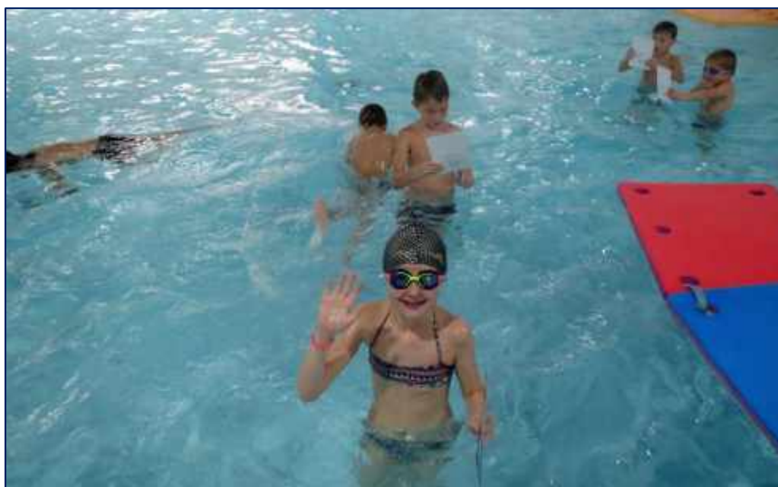
Předávání „mokrých“ vysvědčení na konci kurzu plavání

Výuka plavání probíhala od září do listopadu 2019 v rámci povinné školní tělesné výchovy a zúčastnili se jí žáci 2. a 3. ročníku. Výuku zajišťovala plavecká škola Plavání České Budějovice o. s. Rozsah výuky byl 20 hodin (10 lekcí po 2 vyučovacích hodinách).