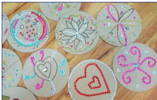
Mandaly – tvoření ve ŠD

Hravé odpoledne s centrem Cassiopeia – pokračování „Ptačího odpoledne“