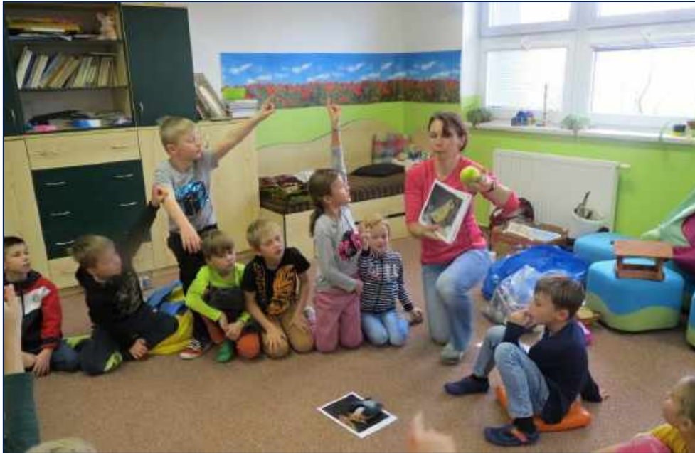
Naučný program Ptáci na krmítku