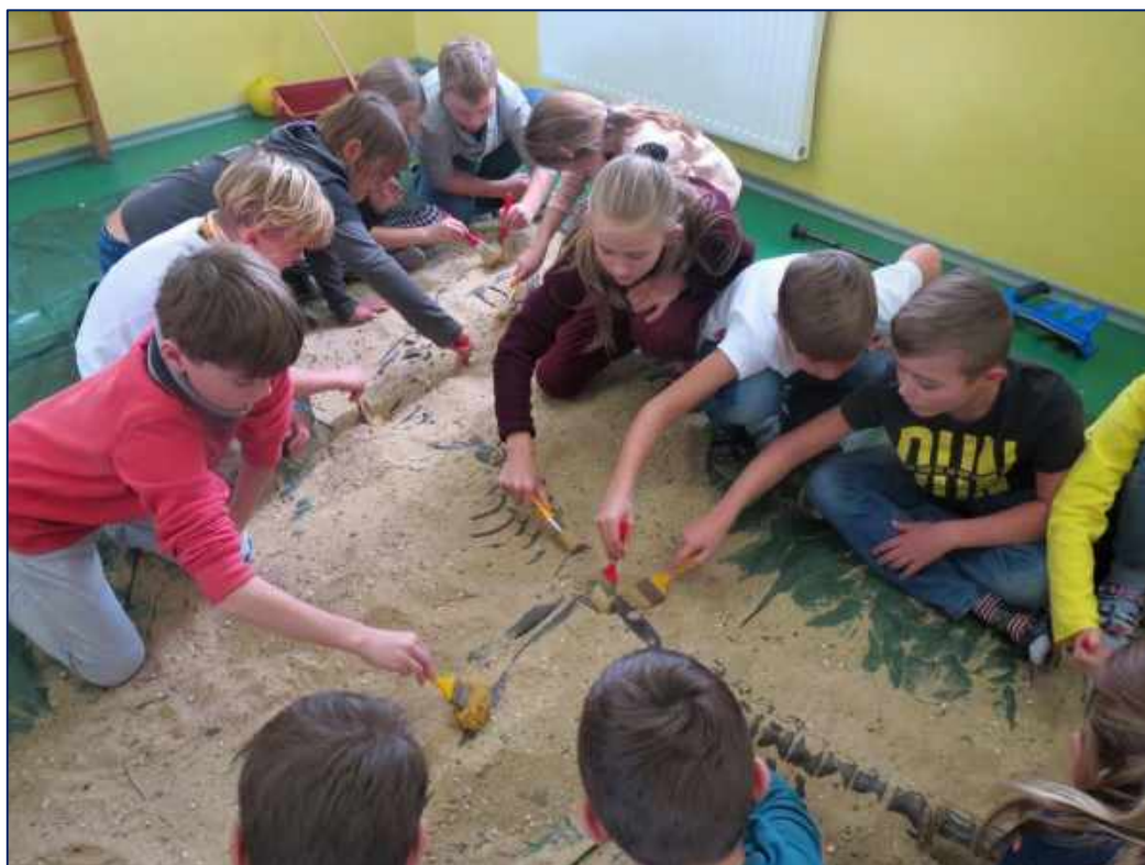
Oživlá historie – badatelské činnosti