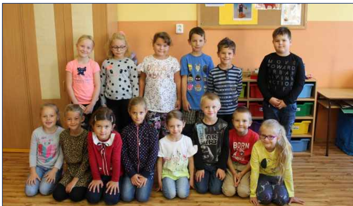
Žáci prvních tříd