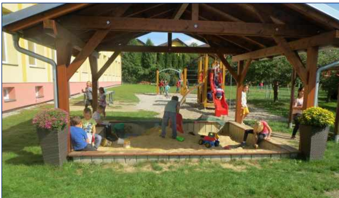
Na zahradě školy