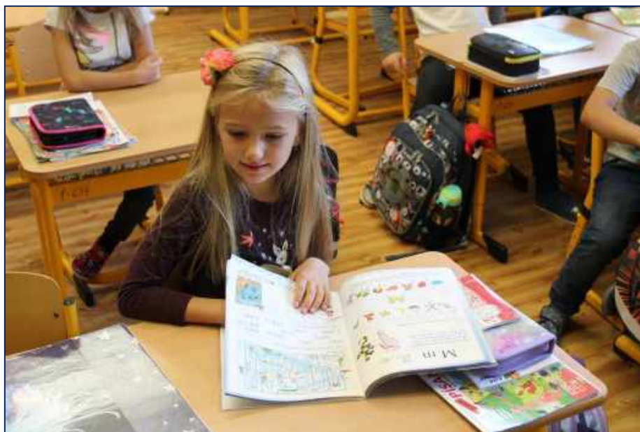
Při výuce v první třídě

V průběhu školního roku 2019/2020 se uskutečnilo 11 oficiálních schůzek metodického sdružení. Po uzavření školy proběhla některá setkání online (přes Skype). Jednání byla především nasměrována na organizační záležitosti ve výchovně vzdělávacím procesu, na řešení pedagogické problematiky výuky a plánování akcí školy. Od března 2020 byla řešena zejména problematika distanční výuky. Mnohé informace, materiály či poznámky k výuce si předávaly paní učitelky i neformálně mimo oficiální schůzky v průběhu celého roku.