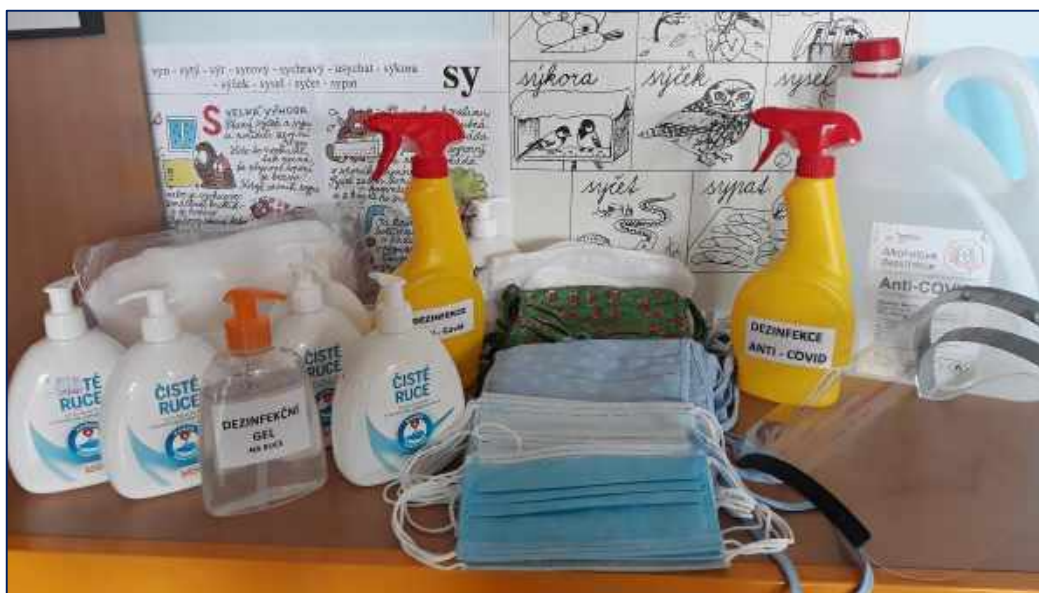
Roušky, štíty, dezinfekce – nezbytné potřeby pro provoz škol

Všechny vzdělávací aktivity byly nepovinné. Rodiče si sami určili, v kolik hodin bude žák ze školy odcházet.