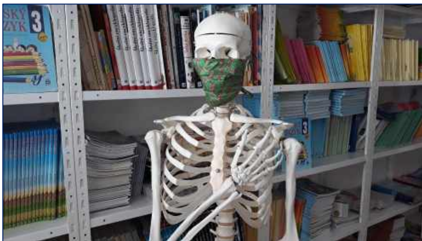
Jedním z koronavirových opatření bylo nošení roušek

Výuka na dálku donutila učitele, žáky i rodiče ke změně po desetiletí budovaných vzdělávacích postupů, návyků i stereotypů. Změněným podmínkám se ale řada aktérů dokázala velmi dobře přizpůsobit. Jaké skutečné dopady toto koronavirové období bude mít, ukáže teprve čas.