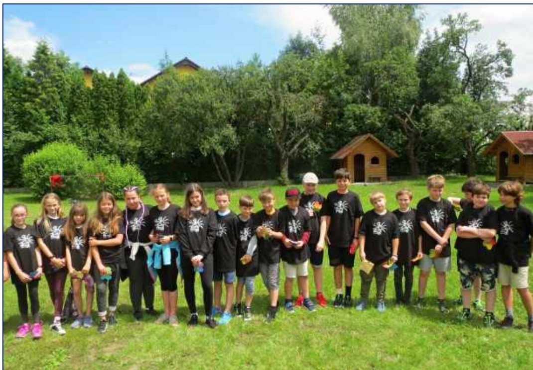
Závěrečné rozloučení se žáky 5. ročníku

Dalším dlouhodobým projektem je pořádání školy v přírodě , která je každým rokem tematicky jinak zaměřena. Ve školním roce 2019/2020 byla naplánována škola v přírodě v rekreačním středisku Máj v malebném, lesy obklopeném prostředí chráněné oblasti u městečka Plasy, situovaného 25 km severně od Plzně. V důsledku koronavirových opatření škola v přírodě neproběhla a byla bez náhrady zrušena .