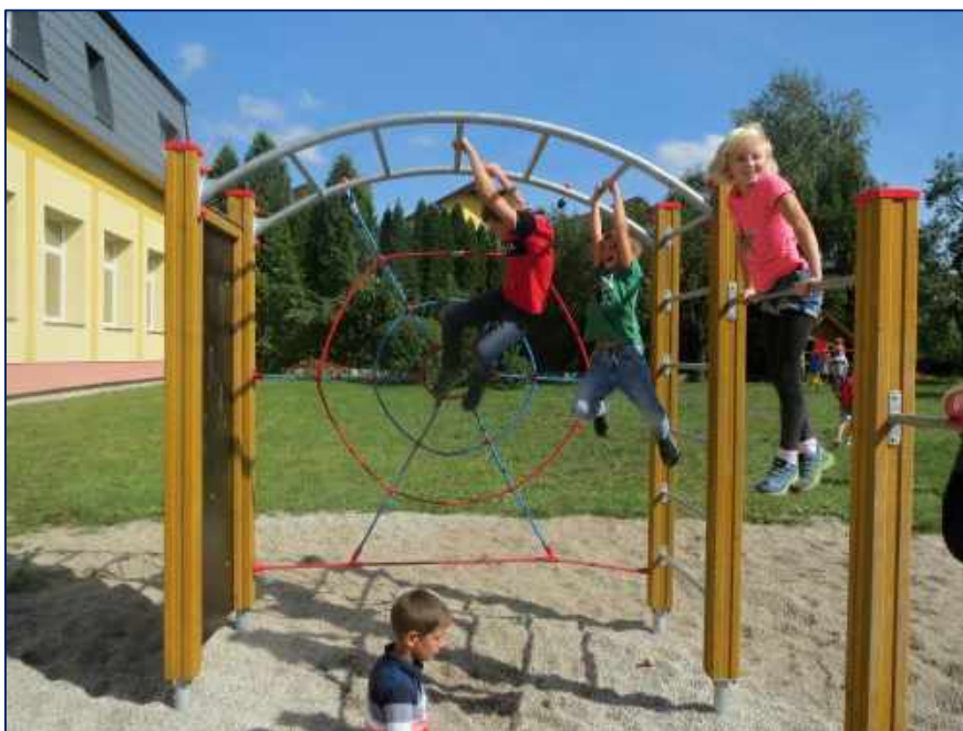
Přestávka na školní zahradě