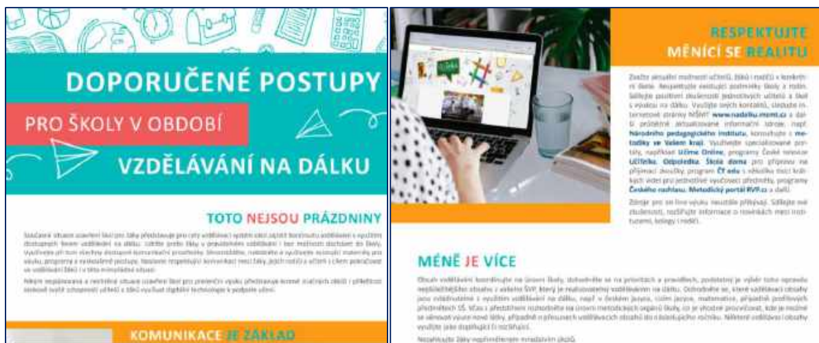
Ministerstvo školství připravilo pro školy soubor základních doporučených postupů pro vzdělávání v době, kdy byli žáci a studenti vzdělávání pomocí dálkových nástrojů.

Situace nebyla jednoduchá nejen pro učitele, ale samozřejmě i pro žáky a jejich rodiče. Mladší žáci, obzvláště na prvním stupni, potřebovali často dennodenní pomoc rodičů. Ukázalo se, že díky uzavření škol vzrostly nerovnosti v přístupu ke vzdělávání. Někteří žáci neměli žádnou možnost online vzdělávání, chybělo jim potřebné technické zázemí, potřebný sociální kontakt, byli nedostatečně motivováni ke školní práci.