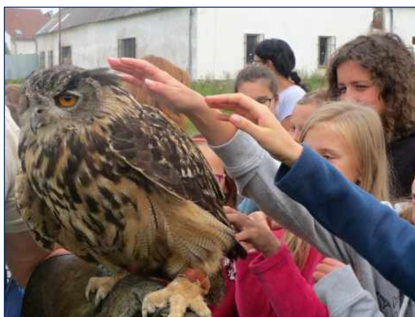
Ze života dravců